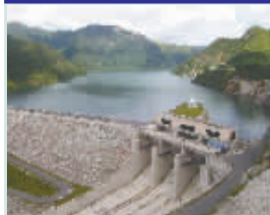
7月10日，原水集团白溪水库子公司正式向宁波提供优质原水，有效缓解了宁波水源配置的压力。