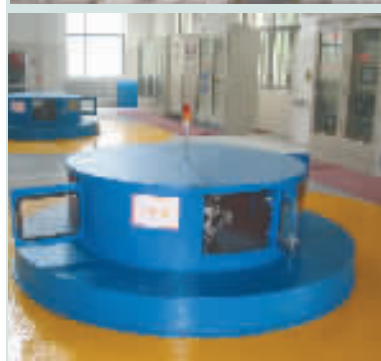
8月21日，周公宅水库电站两台机组通过市发改委组织的电站机组启动验收委员会的验收，开始进入试运行。